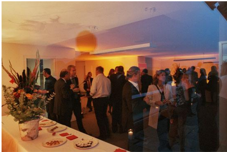
阿里巴巴日内瓦欧洲办事处成立仪式